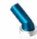
SPAZZOLA ROTONDA ROUND BRUSH