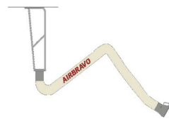
Montaggio su prolunga per installazione braccio a soffitto per rotazione completa a 360°