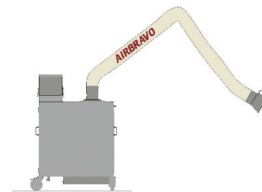
Montaggio su unità di filtrazione carrellata