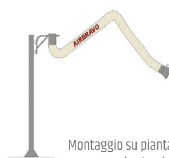
Montaggio su piantana con mensola standard