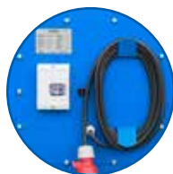
power cord holder