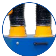
two 160 mm inlets